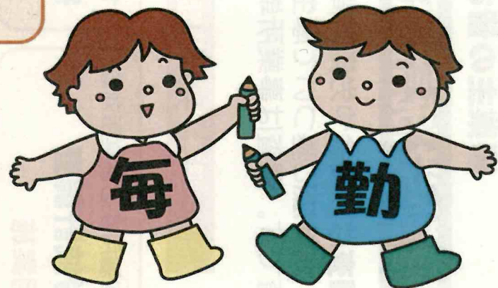
毎月勤労統計調査のキャラクター「まいちゃん きんちゃん」

調査の結果は、 景気の判断や、 社会保障制度を 検討するときの 資料として使わ れます。