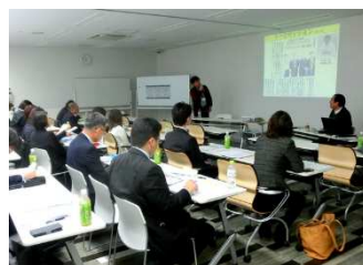
関心を集めています!

求人情報は、当拠点が 東京・仙台・盛岡等の有料人材紹介会社約40社 のほか、 岩手県UIターンセンター、産業雇用安定センター、自衛隊援護協会 などの関連団体に 同時に 送ります。最適と思われる人材が登録されていれば、人材情報が企業に直接届けられます。