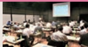
写真2 人材戦略セミナー (北上会場)

●どのように求職者に訴えれば求職者が集まるのか、セミナーでご案内しています(写真2)。多様なご提案を行うほか、御社の気がつかない魅力さがしもお手伝いします。