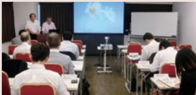
写真1 人材紹介会社にプレゼン (仙台会場)

平成27年12月から実施中の本事業は、県内企業のプロ人材の求人を発掘し、登録している人材紹介会社28社に一斉に取り繋ぎ、求職者とのマッチングを図っています(写真1)。他で培ったスキルや得難い資格を持った有用な人材が確保できます。成約料は必要ですが、書類選考や面接段階では経費がかかりません。