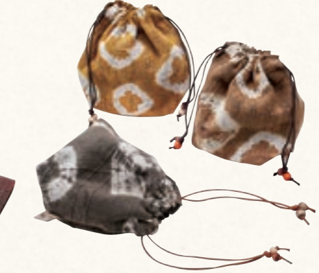
漆染め きんちゃく (株)Patora Garden