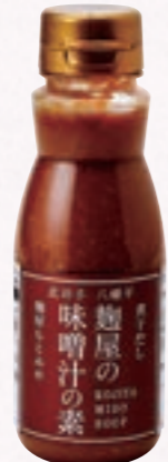
麴屋の味噌汁の素 (株)麴屋もとみや