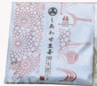
特選 じゃあわせ生姜・極 生姜の佃煮専門店 つむぎ屋