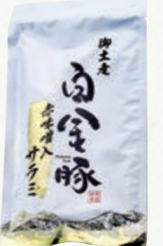
御土産白金豚赤味噌入サラミ 高源精麦(株)