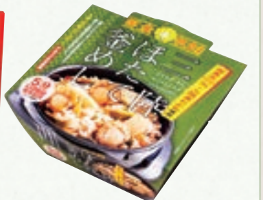
三陸ほたて釜めし (株)水沢米菓