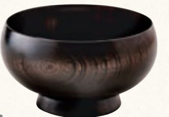
FUDAN 椀 国産漆(生漆・黒漆) (有)丸三漆器