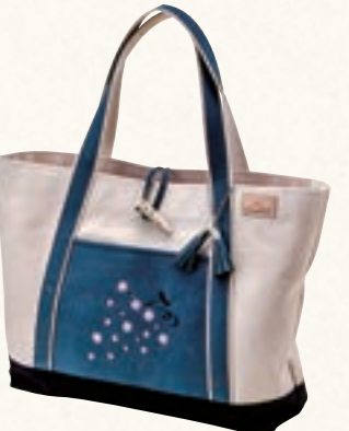
クマ皮使用トートバッグ 糸ばた工房

●お問い合わせ 産業支援部 総合支援チーム いわての物産展等実行委員会 TEL: 019-631-3823