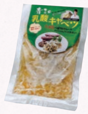
青三の乳酸キャベツ (株)青三