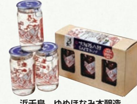
浜千鳥 ゆめほなみ本醸造 大槌孫八郎カップ (株)浜千鳥