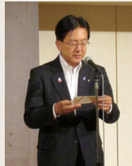
達増拓也 岩手県知事(いわて自動車関連産業集積促進協議会 代表幹事)あいさつ