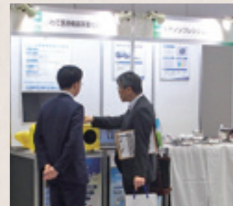
いわて医療機器事業化研究会はロボットリハビリ支援装置を展示