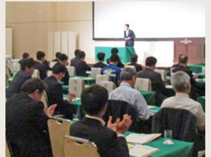
両協議会の合同総会の様子

5月28日(月)に北上市のホテルシティプラザ北上において、「平成30年度いわて自動車・半導体関連産業集積促進協議会 合同総会」が開催されました。