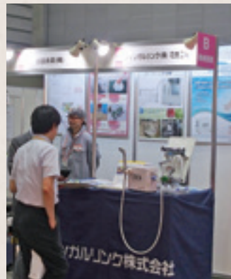
フィンガルリンク(株)の高濃度炭酸水素イオン製造装置

今後ともこのような展示会を通じて県内企業様の優れた技術等を情報発信し、医療機器関連の取引拡大につながるよう努めて参ります。