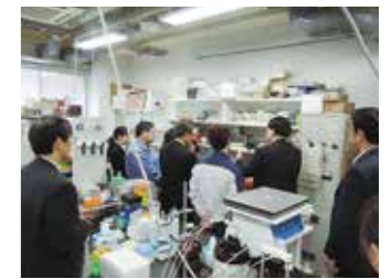
研究テーマ説明と見学

なお、詳細は弊校ホームページ(技術研究会)をご参照ください。(申し込み可) http://www.ichinoseki.ac.jp/techc/research-s/2015/kenkyukai.html