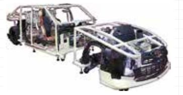
いわてショーケースカー

産学連携による共同研究、岩手からの次世代モビリティ技術の創造・発信に興味をお持ちの皆さまのご来場をお待ちしております。