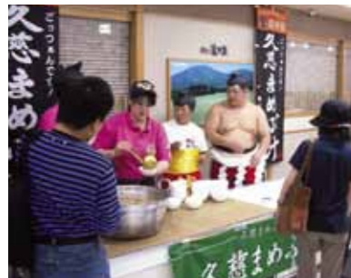
まめぶ汁お振る舞い