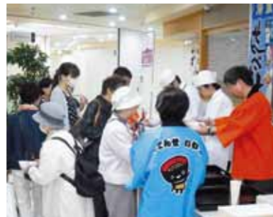
海鮮せんべい汁お振る舞い