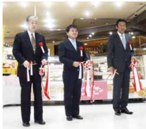
テープカットのようす

出店事業者は、食品61社、工芸品19社、合計80社が参加し、売上も18,850千円(速報値)と、盛況のうちに終了することができました。