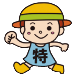
毎月勤労統計調査特別調査 イメージキャラクター「とくちゃん」

なお、この調査は国の重要な統計を作成するための調査として、統計法に基づく「基幹統計調査」とされています。