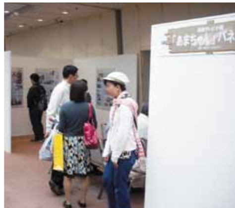
あまちゃんパネル展