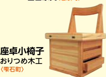
座卓小椅子 おりつめ木工(栗石町)