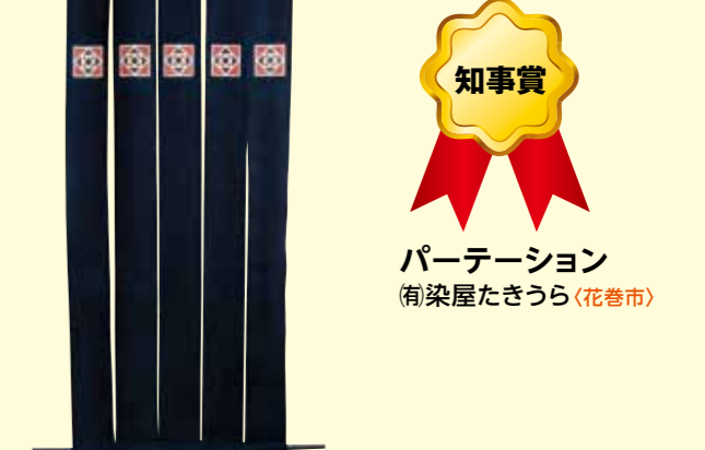
知事賞 パーテーション (有)染屋たきうら(花巻市)