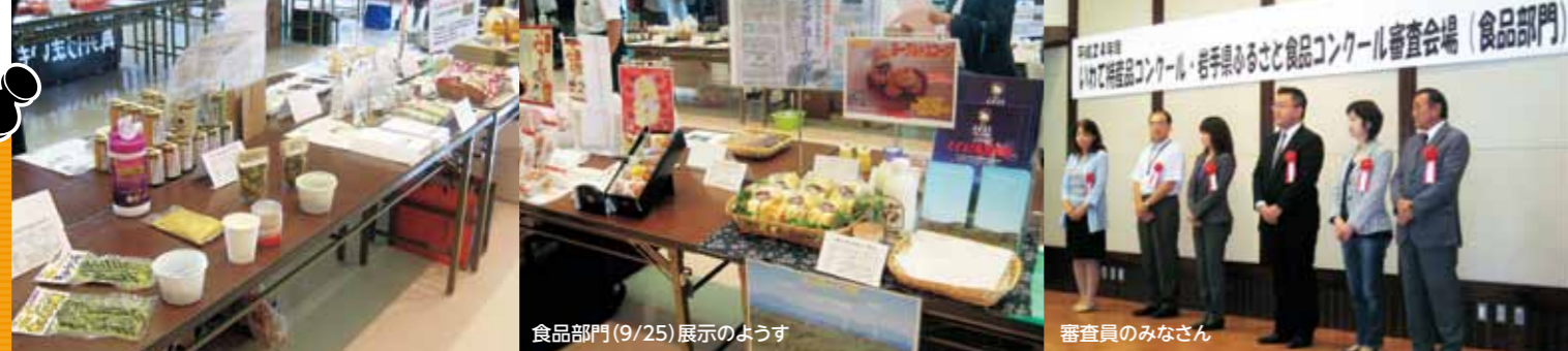
食品部門(9/25)展示のようす