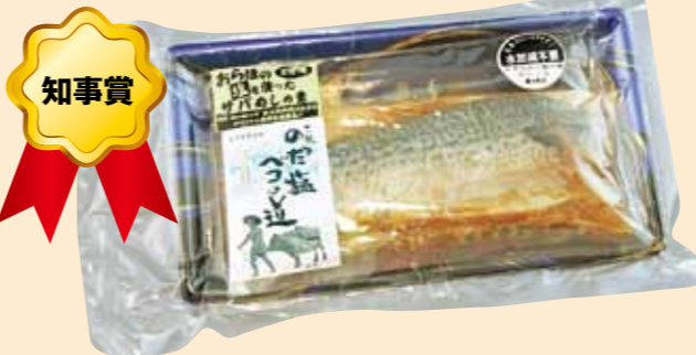
のだ塩さばめしの素 (株)長根商店(洋野町)