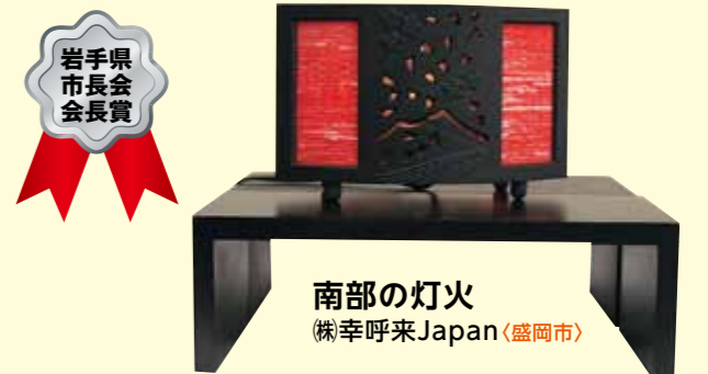
知事賞 南部の灯火 (株)幸呼来Japan(盛岡市)