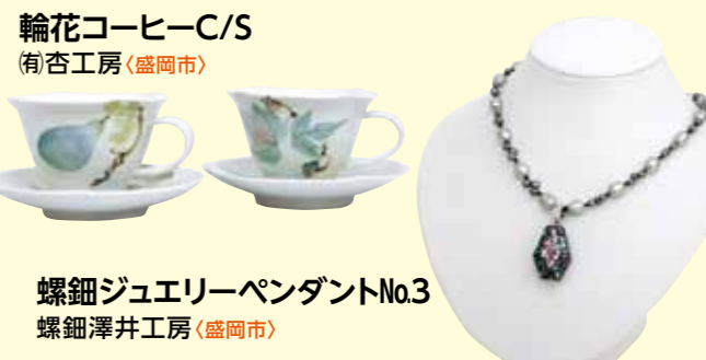
知事賞 輪花コーヒーC/S (有)杏工房(盛岡市)