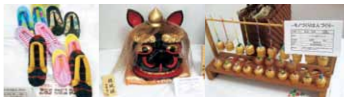
工芸品・生活用品部門の出品品