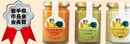
お野菜をたっぷり食べるディップソース (株)浅沼醤油店(盛岡市)