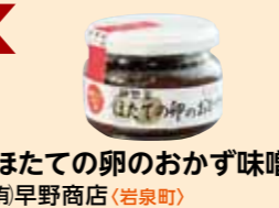
ほたての卵のおかず味噌 (有)早野商店(岩泉町)