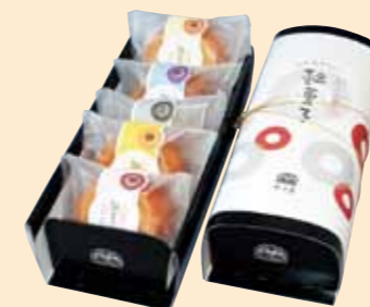
輪菓子 (株)砂田屋(盛岡市)