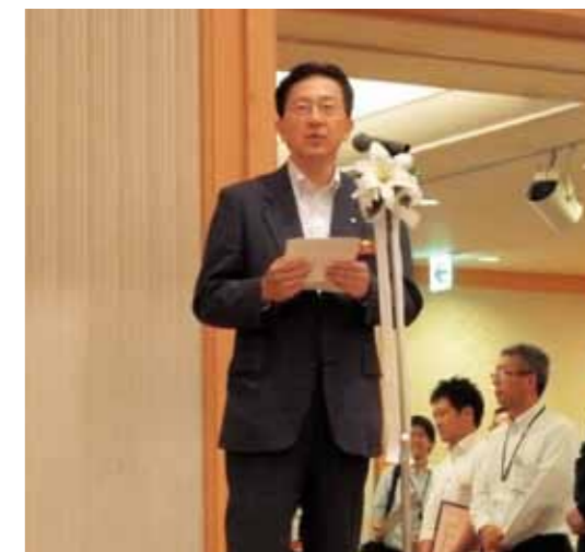
開始前にあいさつを行う達増拓也岩手県知事

商談会は10時30分に開始し、夕方の16時まで行われました。岩手の食産業のさらなる発展が期待されるようです。