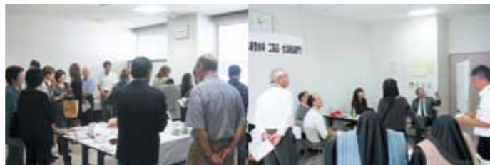
工芸品・生活用品部門(9/26)の審査会 審査中のようす