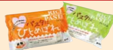
パスタにひとめぼれ 岩手ふるさと農業協同組合(奥州市)