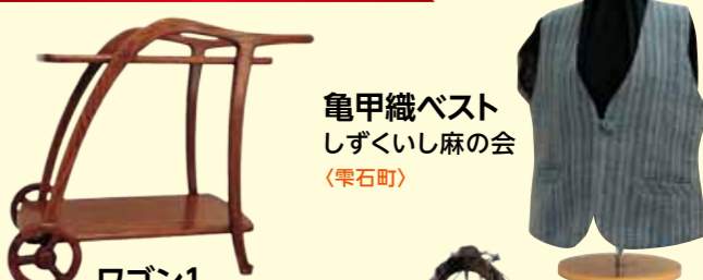
ワゴン1 山口家具(岩泉町)