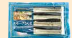
スモークさんま (株)浦嶋商店(大船渡市)