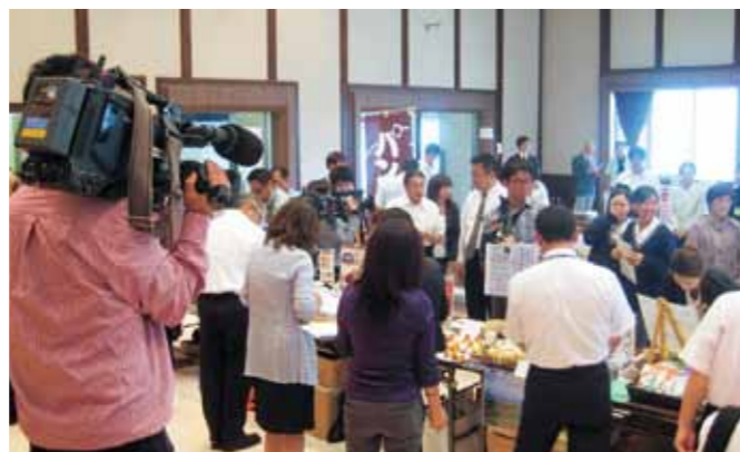
マスコミ各社も取材していました

また、出品者全員が「出品カタログ」へ掲載されます。このカタログは、岩手県アンテナショップ(東京銀座「いわて銀河プラザ」、大阪「jengo」、福岡「みちのく夢プラザ」)に配置されるほか、各種物産展でも配布されます。