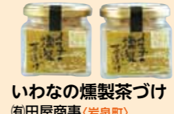
いわなの燻製茶づけ (有)田屋商事(岩泉町)