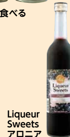
Liqueur Sweets アロニア 赤武酒造(株)(盛岡市)