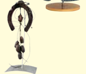
繭鈴MAYURIN 工房夢繭・花(盛岡市)