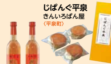
じばんぐ平泉 きんいろばん屋(平泉町)