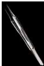
コバルト合金製ピンセット

生体適合性(金属イオン溶出、細胞毒性等)に優れ、高い機械特性(強度、硬さ等)、疲労強度、耐摩耗性、耐食性を有します。