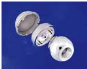
コバルト合金製人工股関節

【特徴】従来のコバルト合金(ニッケル含有率 0.1%程度)に比べ、ニッケルの添加を極力抑え(含有率 0.01%程度)ながらも、十分な加工性を有する合金です。