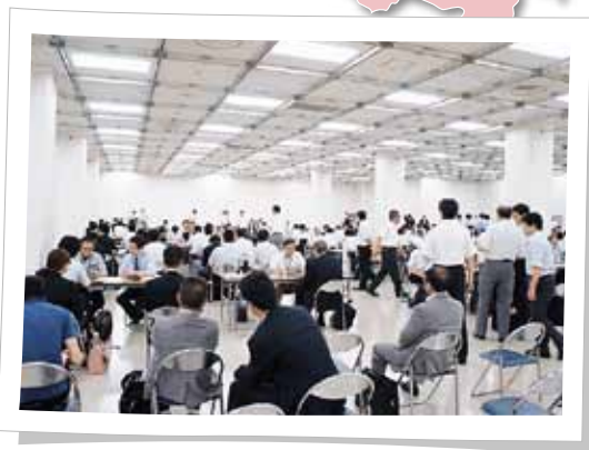
昨年度の合同商談会のようす

この機会に是非ご参加いただき、北東北3県における新規取引先の開拓や、新たなパートナーづくりにご活用くださいますようお願い申し上げます。