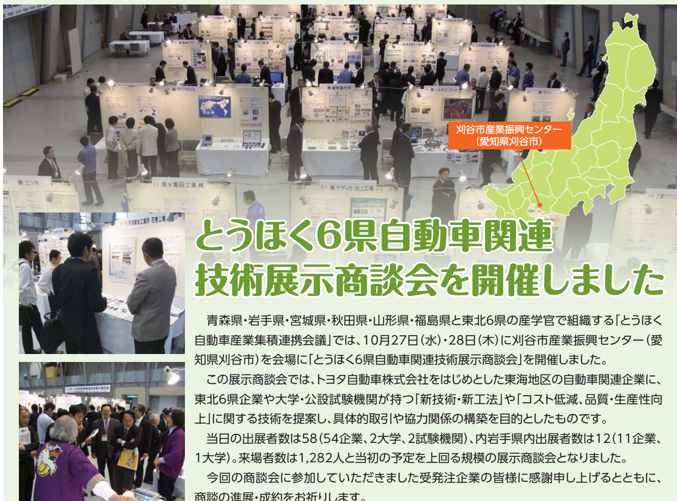
刈谷市産業振興センター (愛知県刈谷市)