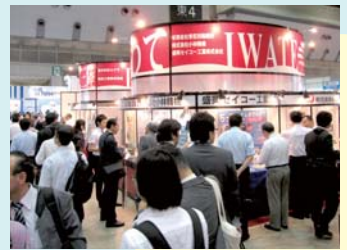
岩手の共同出展ブース

この展示会は日本最大級の集客力を誇り、製造業の設計技術者、研究開発者、生産技術者、購買・資材担当者など多数の来場者があり、今回は3日間で延べ84,353人（23日25,251人、24日28,327人、25日30,775人）の来場者を数え、会場のいたるところで名刺交換や具体的な商談が行われていました。