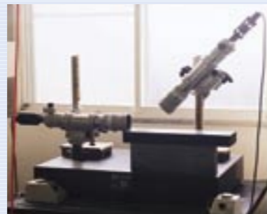
▲オートコリメーター ◀アルマイト処理槽